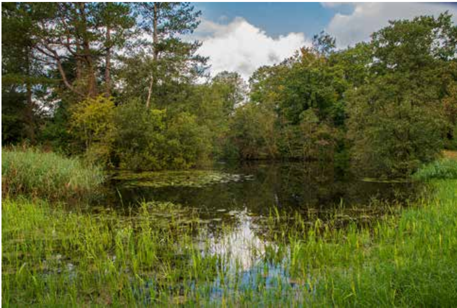
De grote vijver.