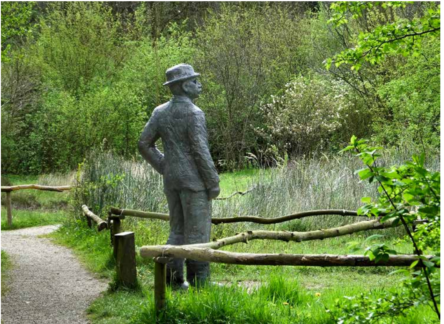
Thijse kijkt uit over zijn tuin.