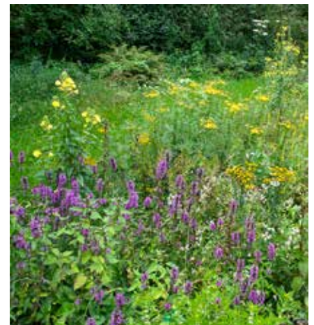
Voorbeeldstrook met zomerbloemen.

"Het komende jaar staat helemaal in het teken van dit eeuwfeest. In maart verschijnt onze glossy met ruim honderd pagina's mooie verhalen, er