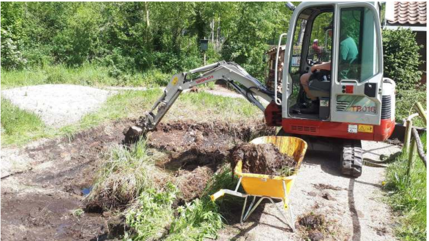
De dichtgegroeide kleine vijver wordt uitgegraven.

zaken gingen zij weer terug en het grind werd vervangen. Niet eenvoudig om een paar kub weg te halen, maar na twee dagen hard werken zien de paden er weer mooi uit en loopt het water weer netjes naar de kanten. Ook hebben zij het terras vergroot, dit om meer ruimte te creëren voor activiteiten zoals de Stinzenplantendag en de vrijwilligersdag.