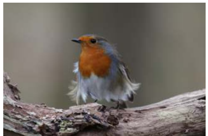
Wat wind onder de veren..