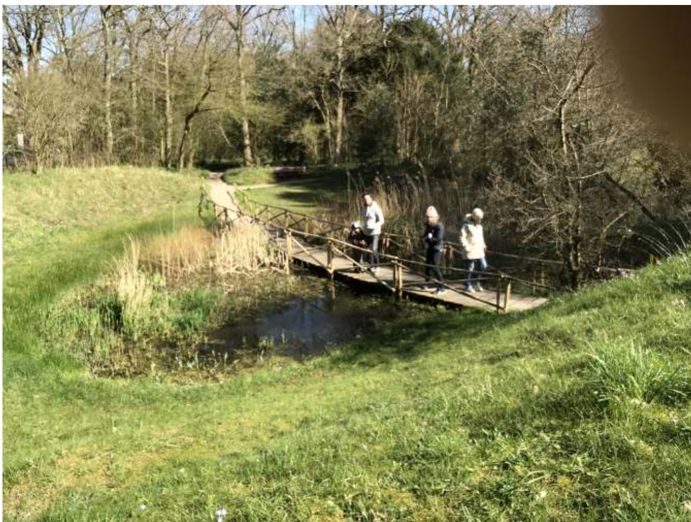
Het moerasje waar de kwel begint. Vervolgens onder het bruggetje door naar de vijver.

Er ontstaat er een roestbruine neerslag op de bodem, en op het wateroppervlak verschijnen prachtig gekleurde vliezen. Die worden gevormd door een bacterie die het ijzer als voedsel benut. Aangenaam kennismaken: Lepthotrix discophora , de ijzervreter.