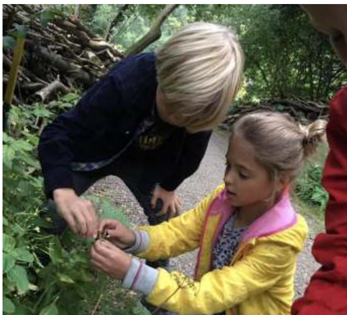
Onderzoek buiten. En binnen bij de imker