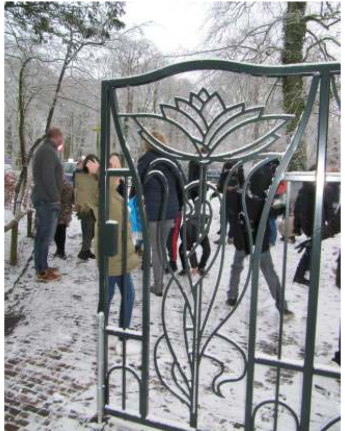
Het nieuwe toegangshek

De inzet van de tientallen vrijwilligers is cruciaal voor Thijsses's Hof. Om het grote aantal bezoekers van maar liefst ruim 15.000 bezoekers goed te kunnen opvangen, maar ook om Thijsses's Hof het