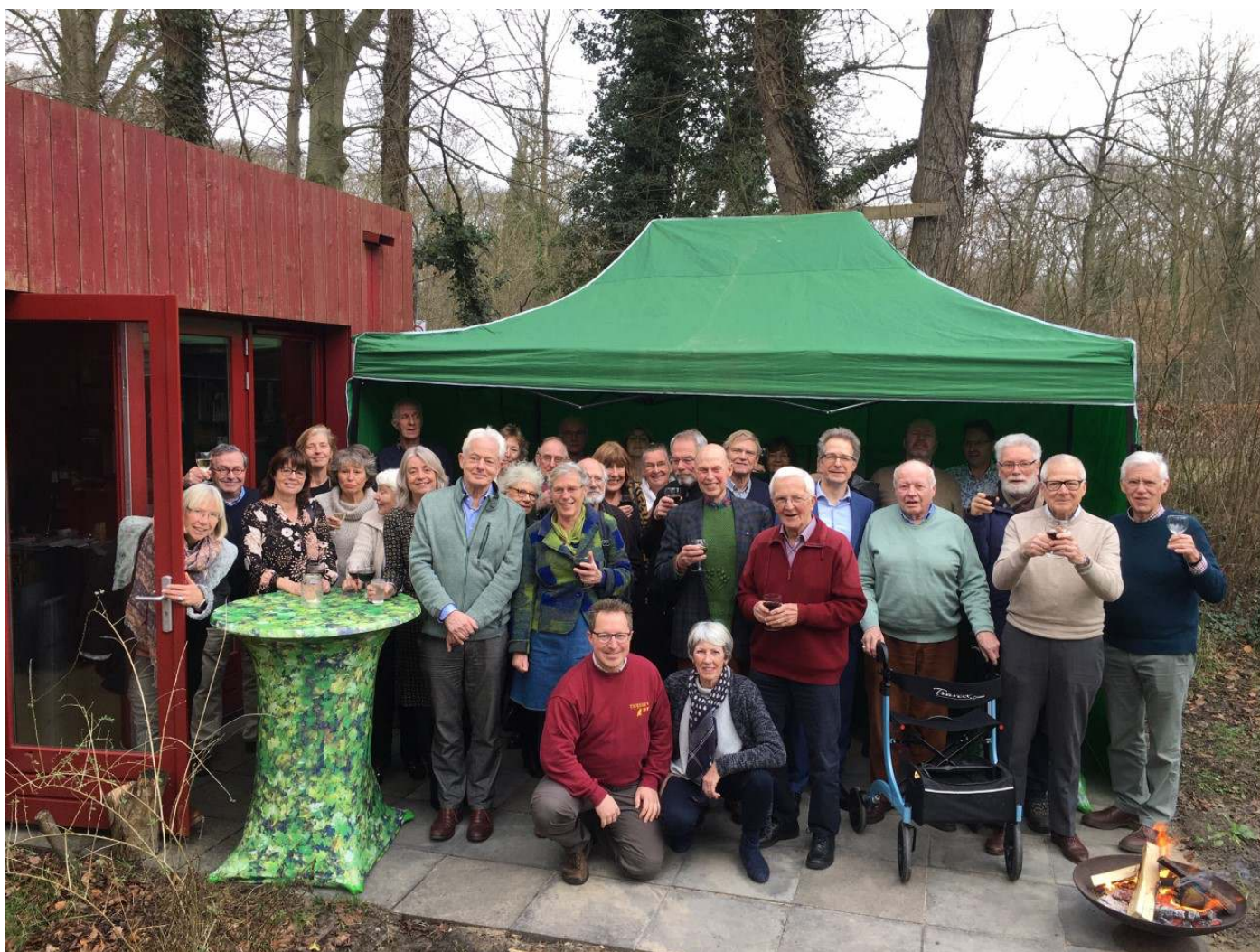
Een gedeelte van de vrijwilligers tijdens de Nieuwjaarsbijeenkomst (11 januari 2020). Door het zachte winterweer kon er buiten geproost worden.