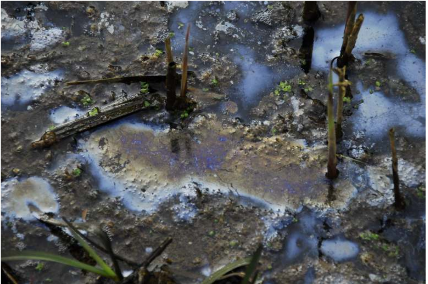
De "IJzervreter" laat (ongevaarlijke) sporen na: prachtig gekleurde vliezen op het kwelwater

Pal naast het nieuwe hek kondigt een bloeiend Lenteklokje het voorjaar aan; tegelijk laat het waterpeil van onze centrale vijver zien hoe hard het de afgelopen herfst heeft geregend. Zo kijken we hartje winter voor- en achteruit. De seizoenen zijn lang niet zo afgeperkt als wij menen. Mochten we opnieuw een hete zomer krijgen, dan zal het water in de vijver net als in de voorafgaande jaren akelig laag komen te staan.