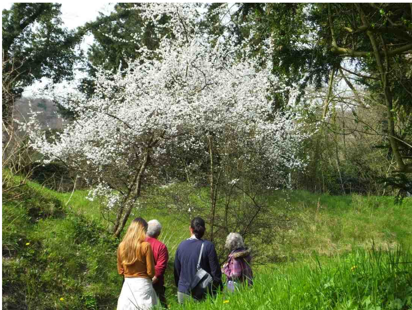
Bezoekers zijn onder de indruk van de Sleedoornpracht

Voor de Beatrixschool groep 3/4 werd een speciaal herfstthema geregeld. Bijzonder altijd weer om met die jonge kinderen de Hof rond te gaan.