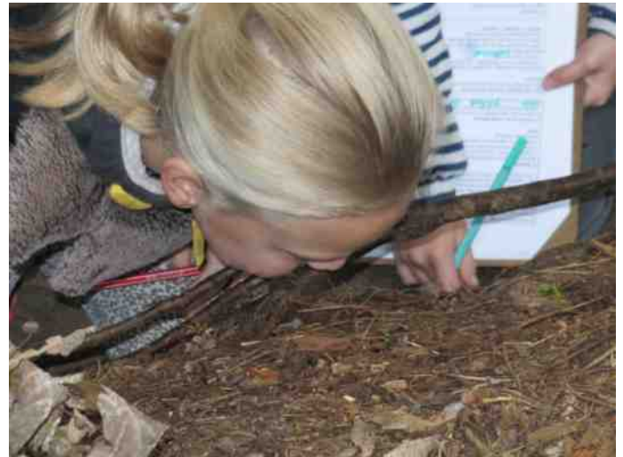
Onderzoek naar geur en structuur van bosgrond. Herfstpad 2015.