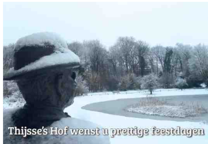
Thijsses Hof wenst u prettige feestdagen

Thijsses Hof is niet alleen de eerste en daarmee de oudste heemtuin van Nederland, maar zoals gezegd tevens het oudste voorbeeld van natuurontwikkeling. De grote invloed die Thijsses heeft gehad op de bescherming, het beheer en de educatie van de natuur in ons land wordt weerspiegeld in deze tuin. Thijsses Hof is door het zorgvuldige en liefdevolle beheer vanaf de oprichting gaaf aan de huidige generatie overgeleverd en vervult nog steeds een grote educatieve rol. De Hof slaagt er nog altijd in om mensen de schoonheid van de natuur te laten beleven.