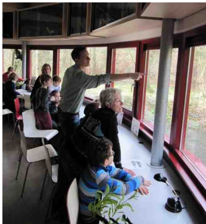
Tijdens het Winterpad waren we twee zondagen exclusief geopend voor de vogelspotters

IBAN nr.NL59ABNA0500729891 ten name van: Stichting Thijssse's Hof te Bloemendaal