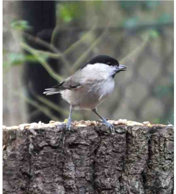
Glanskopmees op de voederplank

Er zijn 16 nestkasten in de Hof en zoals alle voorgaande jaren worden deze bevolkt door pimpel- en koolmezen. Behalve de bosuilkast; daar zit al sinds jaar en dag een holenduif en die legt altijd twee eieren en soms komen er ook twee jongen groot. Helaas dit jaar maar 1 jong. En de torenvalkkast is zoals elk jaar leeg. En de bosuil? Ja, je hoort hem wel, maar zelden in de Hof. Dus erg spannend is het niet en ook nooit geweest in de nestkasten. Wel leuk, vooral als ik op zondag de kasten controleer en toevallige passanten met