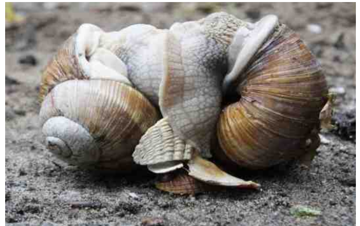
Wijngaardslakken. Als ze geluk hebben komen ze elkaar tegen. En dan krijg je dit.

De bevolking van 'kriebelbeestjes' in de Hof is minder goed bekend dan de vogelstand en de plantensoorten. Het is ook een hele opgave om de insecten in de Hof te herkennen. De dagvlinders en de libellen zijn wel goed bekend, want zij zijn goed herkenbaar en vliegen overdag met mooi weer. Deze 'aaibare' soorten zijn maar een fractie van het aanwezige leven. In Nederland zijn meer dan 19.000 insectensoorten aanwezig, en dan hebben we nog de slakken, duizendpoten, miljoenpoten, spinnen en nog veel meer. Laten we ook de mossen en de paddenstoelen niet vergeten. Gelukkig zijn er bezoekers in de Hof, die de vele soorten in de Hof helpen te be-