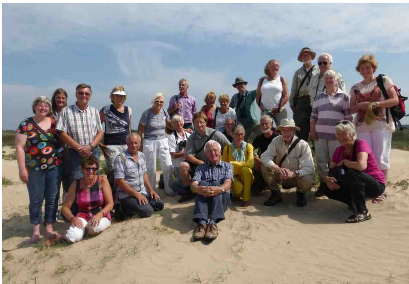
De vrijwilligers bij het jaarlijks uitje, dit keer naar de Houtglop in de Kennemerduinen