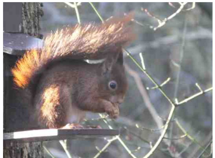
De eekhoorn weet wel raad met de pinda's