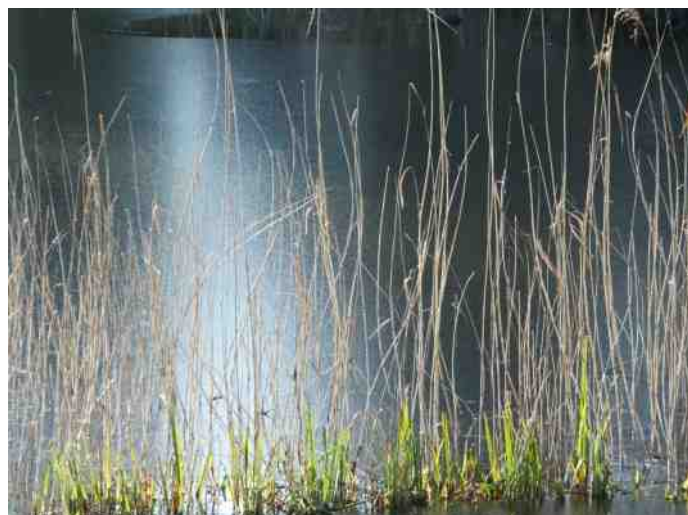
Riet langs de grote vijver