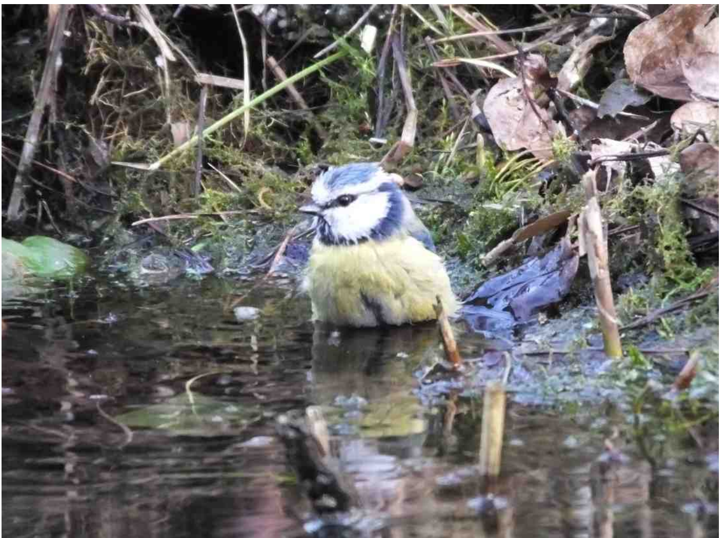
Pimpelmees aan het badderen in de kleine vijver