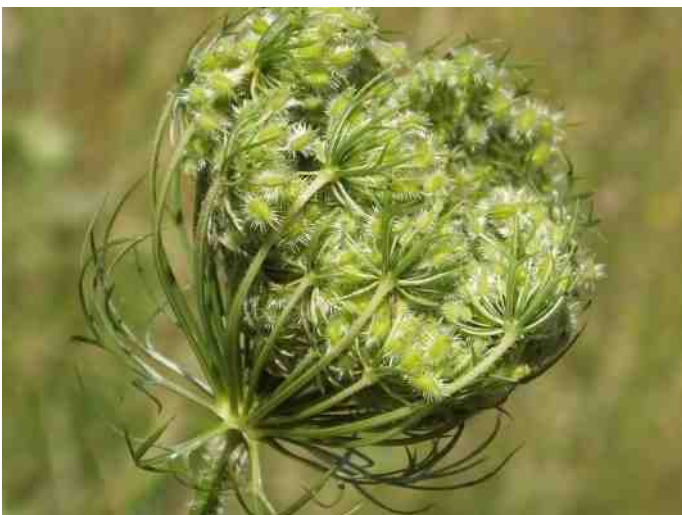
Wilde peen na de bloei

Daslook breidt zich volgens onze waarnemingen minder snel uit dan gevlekte aronskelk, maar waarschijnlijk zal deze soort in de toekomst sterk toenemen en plaatselijk gaan domineren, vooral in de lagere en vochtiger delen van het bos zoals dat ook in Thijsse's Hof is gebeurd. Verder is de kans groot dat diverse in de tabel vermelde soorten zich zullen uitbreiden en dat andere soorten, waaronder donkere ooievaarsbek, zich mettertijd in het Bloemendaalse Bos zullen vestigen.