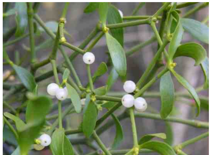
Maretak op drie plaatsen in de Hof