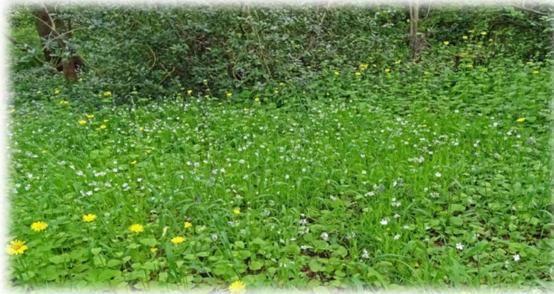
Grote muur met Voorjaarszonnebloem