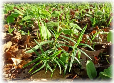
Na de winterslaap

Let ook op de mooie donkergroene bladeren, die in een lange punt uitlopen. Aan de randen en op de nerf voelen ze ruw aan.