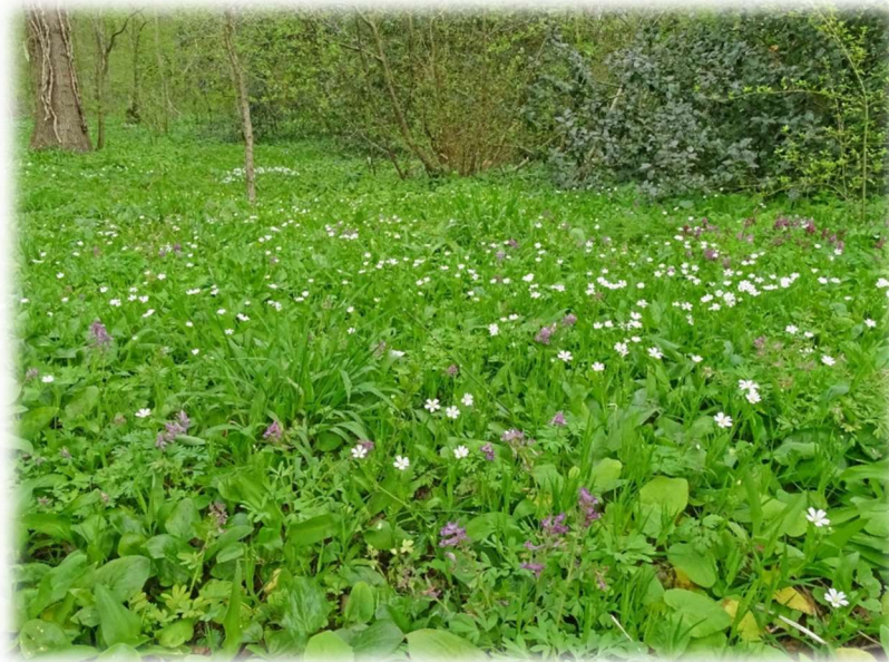
Grote muur met Vingerhelmbloem

U vindt onze Aprilplant op verschillende plaatsen in Thijse's Hof. Altijd op de bosbodem en vaak, zoals de foto's ook tonen, samen met andere prille schoonheden. Een mooie plek om hem te bewonderen is ter hoogte van het beeld van Jac. P. Thijse. Hij staat er nota bene met zijn rug naar toe.